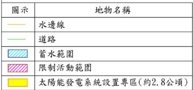
附圖一 湖山水庫太陽能發電系統設置專區