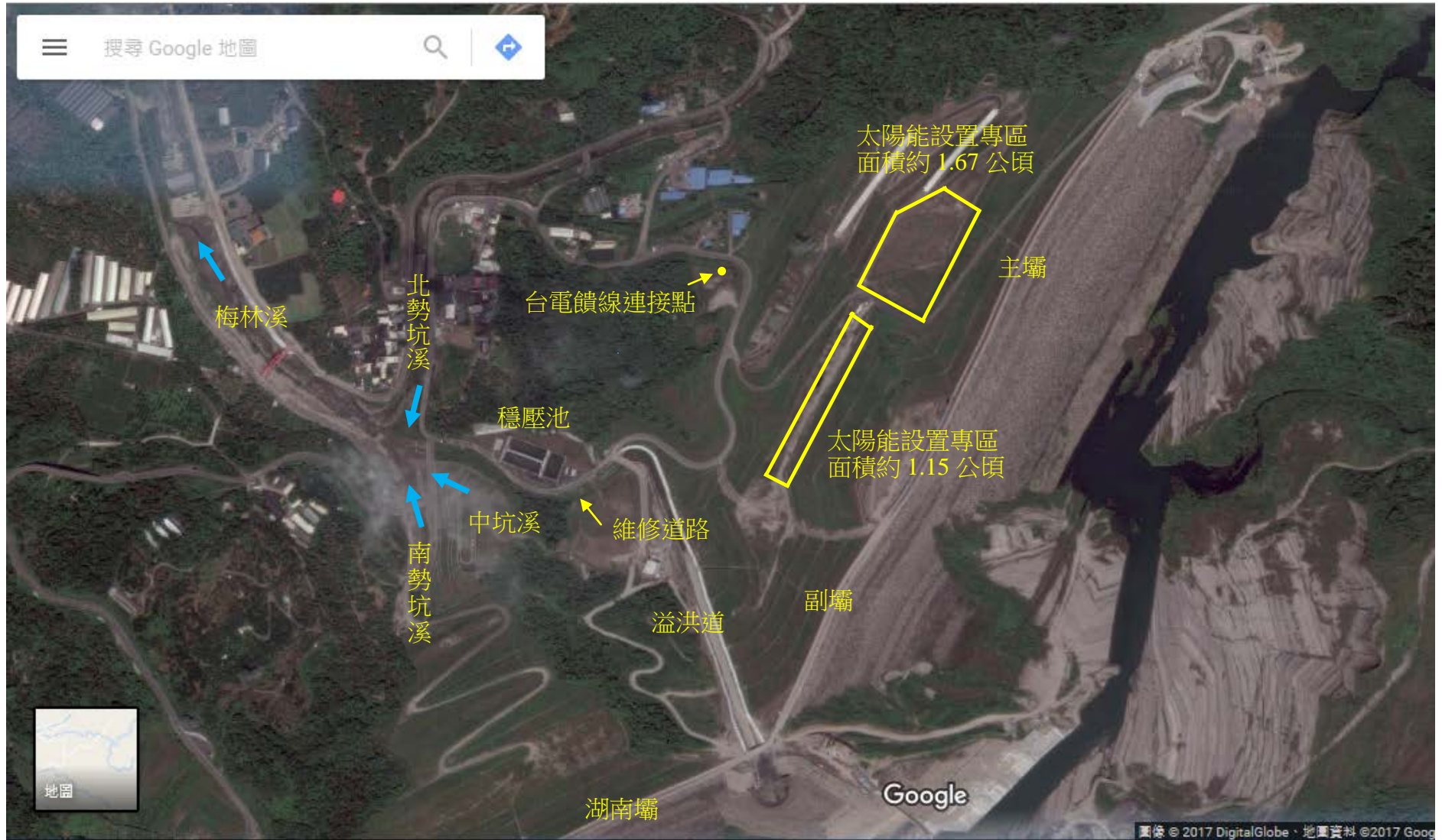
附圖二 計畫標的周邊台電配電饋線平面示意圖